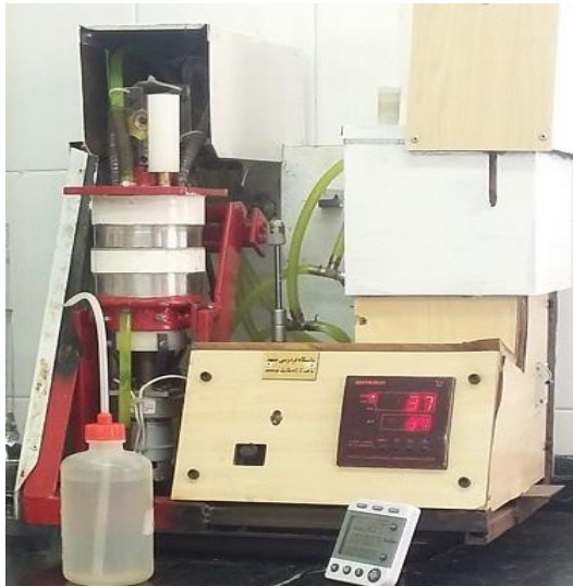
شکل ۱ - دستگاه شبیه‌ساز دهان

استفاده گردید (شکل ۱). تنظیم pH با استفاده از محلول‌های ۰/۱ نرمال اسیدکلریدریک و هیدروکسید سدیم انجام شد.