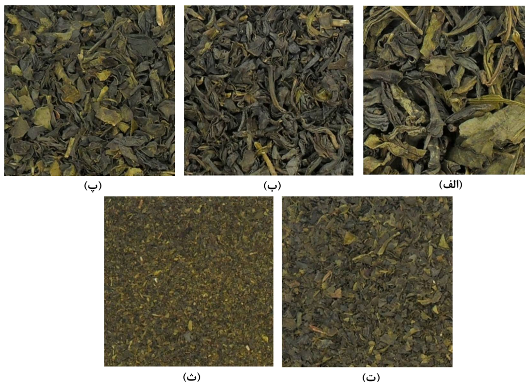
شکل 1- تصاویر نمونه‌های چای سبز مورد بررسی در این پژوهش؛ الف) چای سبز قلم، ب) چای سبز شکسته ممتاز، پ) چای سبز شکسته، ت) چای سبز باروتی، ث) چای سبز خاکی

قرار گرفت و تصاویر در حالت فلاش خاموش 3 و ایزو 4 100 تهیه شدند. نمونه‌های چای سبز روی یک سطح سفید و مات (مقوای سفید غیرروغنی) قرار داده شدند و دوربین عمود بر سطح نمونه‌ها و در فاصله 30 سانتی‌متری آنها نصب شده و عملیات عکس‌برداری انجام شد. 8 تصویر رنگی (RGB) با بزرگ‌نمایی یکسان برای هر درجه کیفیت چای سبز تهیه شد.